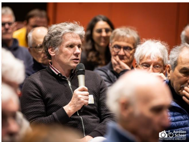
Kit solaire et scolaire