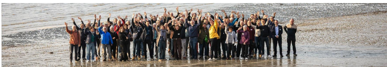
Kit solaire et scolaire